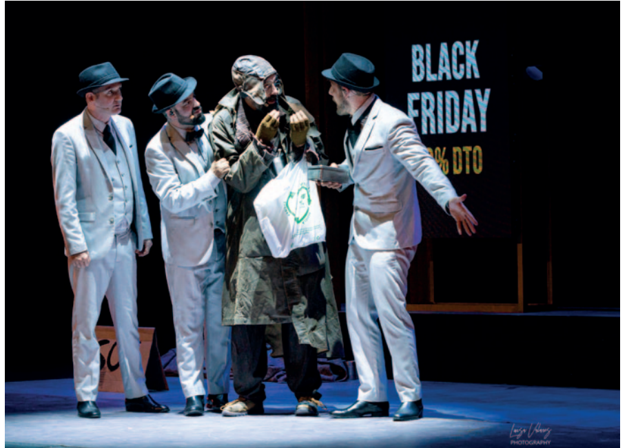
Completan la programación varias exposiciones de temática variada y la habitual oferta de la Biblioteca Pública: una representación teatral, dos

La oferta para el público infantil y familiar la componen Dubbi Kids La Ratonera Teatro con "Chiquitina, la reina de los bosques", Ganso & Cia con "Welcome & Sorry", Pasadas las 4 con "Soñando con Peer Gynt" y el Taller de Teatro CCN con "Los tres pelos de oro de la cabeza del diablo". La danza vuelve a Noáin como cada primavera, en esta ocasión de la mano de DNA Dinamo Danza y su espectáculo "Qualia" y la compañía iXa con "3 Historias de dos", lo mismo que la música, con un concierto del Coro Juvenil y el Coro Valle de Elorz en abril y las actuaciones en el Parque de los Sentidos de Her Itage y la Orquesta Reusónica Dúo.